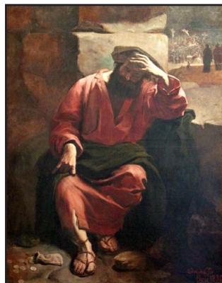
Ἡ ἐνοχὴ τοῦ Ἰούδα. Πίνακας τοῦ José Ferraz de Almeida. Ἐθνικὸ Μουσεῖο ντὲ Μπέλας Ἄρτες, Ρίο ντὲ Τζανέιρο, 1880.

Κατὰ τὴν ρητὴν μαρτυρία τοῦ ἰδίου τοῦ Κυρίου, ὁ ἴδιος ὁ Κύριος ἐξέλεξε τοὺς Ἀποστόλους καὶ ὄχι οἱ Ἀπόστολοι Αὐτόν: «Οὐχ ὑμεῖς με ἐξελεξασθε, ἀλλ' ἐγὼ ἐξελεξάμην ὑμᾶς» (Ἰω. ιε' 16).