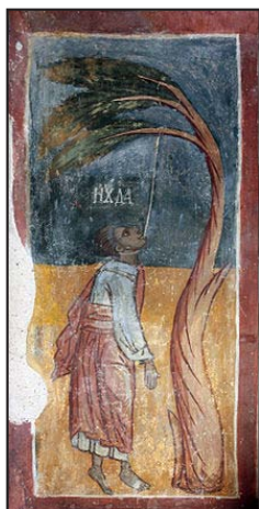
Τοιχογραφία (15 ο αι.), Γ. Μ. Προφήτου Ἡλίου, Στρουπέτσ Βουλγαρίας. Ὁ Ἰούδας κρεμάμενος (Ματθ. κζ' 1-10).

χοῦ καὶ τῶν ἀγαθῶν καὶ τῶν κακῶν» (ΕΠΕ, τόμος 35, σελ. 572).