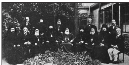
Πανορθόδοξο Συνέδριο τῆς Κωνσταντινουπόλεως - 1923.

χικῶς Διαχριστιανικῆς Ὁμοσπονδίας, εἶχαν ὡς θεμέλια τρεῖς ἀντορθόδοξες καὶ ἀντεκκλησιαστικὲς θεωρίες, τὶς ἐξῆς: α. τὴν λεγομένην Βαπτισματικὴν Θεολογίαν, β. τὸν Δογματικὸν Συγκρητισμὸν καὶ γ. τὴν Ἐγκοσμοκρατικὴν Προοπτικὴν.