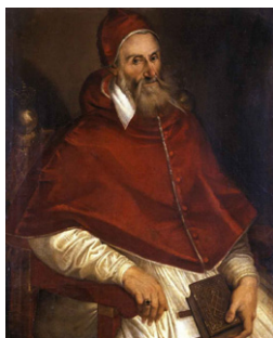
Πάπας Γρηγόριος ΙΓ' (1831-1846).

ήμερολογιακῆς ταύτης μεταρρυθμίσεως καὶ συνεδέετο αὕτη πρὸς τὴν λοιπὴν γνωστὴν σειρὰν τῶν διαφόρων καινοτομιῶν τῆς παπικῆς Ἐκκλησίας», καθ' ὅσον «ἢ ὑπὸ τοῦ Πάπα Γρηγορίου τοῦ ΙΓ' τῷ 1831 ἐπενεχθεῖσα ἡμερολογιακὴ μεταρρυθμίσις ἀνέκαθεν ἢ μᾶλλον εὐθύς ἀμέσως ἐθεωρήθη ἐν τῇ Ὁρθοδόξῳ Ἀνατολῇ ὡς καινοτομία ἐκκλησιαστικὴ καὶ θρησκευτικὴ καὶ ὡς μία ἐκ τῶν συνήθων τάσεων τῆς κρατούσης ἐν τῇ Δύσει ἐκκλησιαστικῆς ἀπολυταρχίας, τὸ ὄνειρον τῆς ὁποίας ἦν καὶ ἔστι καὶ ἔσται ἡ ἐπέκτασις τῆς ἐπιρροῆς αὐτῆς ἐπὶ τῆς Ὁρθοδόξου Ἀνατολῆς. Ἐθεωρήθη, ἄλλαις λέξεσι, νέα παπικὴ ἐκστρατεία κατὰ τῆς ἐν Ἀνατολῇ Ὁρθοδοξίας. Ὡς τοιαύτη θεωρηθεῖσα καὶ ἐκτιμηθεῖσα ἡ καινοτομία αὕτη ἀμέσως κατεδικάσθη» 3 ὑπὸ τῆς Ὁρθοδοξίας ἐν Συνόδοις.