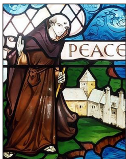
Βιτρώ με τόν Όσιο Σειριόλο.

Υπάρχουν σωζόμενες μεσαιωνικές ιστορίες, οί όποιες αναφέρονται σέ Θαύματα, τὰ όποία έκαναν οί άνθρωποι του Θεού Σειριόλος και Κύβιος, οί όποιοι ζούσαν στο ανατολικό και δυτικό Άνγκλεσι αντίστοιχα. Και οί δύο τους τιμώνται ως Προστάτες-Άγιοι του Άνγκλεσι και λέγεται, ότι «οί προσευχές τους προστάτευαν πλήρως τὸ νησί».