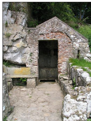
Ναός του Όσιου Σειριόλου. Τμήμα Κέλτικου Σταυρού. Ίερό φρέαρ. Πένμον.