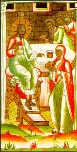
Μικρογραφία (1693), κώδ. ΒΑΝ Αρχ. κομ. 379 φ.

ἀργυρος Ἰούδας σκανδαλίζεται, τάχα διὰ τὴν ἀπώλειαν τοιούτου μύρου. Ὁ Ἰησοῦς ἐπιπλήττει αὐτόν, ἵνα μὴ ἐνοχλῇ τὴν γυναῖκα· καὶ ὁ Ἰούδας ἀγανακτῶν πορεύεται πρὸς τοὺς ἀρχιερεῖς, συνηγμένους εἰς τὴν αὐλὴν τοῦ Καϊάφα καὶ συμβουλευομένους ἤδη κατὰ τοῦ Ἰησοῦ· καὶ συμφωνήσας μετ' αὐτῶν τὴν προδοσίαν τοῦ διδασκάλου διὰ τριάκοντα ἀργύρια, ἀπὸ τότε ἐζήτηε εὐκαρίαν ἵνα αὐτὸν παραδῶ. Ἔνεκα τούτου ἔλαβεν ἀρχὴν ἀπ' αὐτῶν τῶν ἀποστολικῶν χρόνων ἡ νηστεία τῆς Τετράδος.