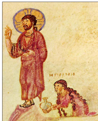
Μικρογραφία (Θ' αἰ.), κώδ. 61, φ. 118α, Ἱ. Μ. Παντοκράτορος Ἄθωνος.

ἦτο προσφυστάτη, δυσηρέστησε τὸν Θεόφιλον, καθὸ ἀποδείξασα, ὅτι ἡ νέα αὐτῆ εἶχεν εὐφυΐαν, πλειοτέραν τῆς προσηκούσης εἰς σύζυγον, οἷαν αὐτὸς ἐπεθύμει· ὅθεν προχωρήσας ὀλίγα ἔτι βήματα προσέφερε τὸ μῆλον εἰς τὴν σεμνὴν καὶ εὐλαβῆ Θεοδώραν. Ἡ εἰκασία δὲν θέλησε πλέον νὰ ἐπανέλθῃ εἰς τὸν κόσμον, ἀλλὰ κτίσασα Μοναστήριον διέζησεν ἐν αὐτῷ τὸ ἐπίλοιπον τοῦ βίου, προσευχομένη καὶ ἐκφράζουσα διὰ πολλῶν ἐμμέτρων καὶ μὴ ἐμμέτρων συγγραφῶν τὴν πρὸς τὸν Θεὸν εὐλάβειαν καὶ τὴν περὶ τῆς ματαιότητος τῶν ἀνθρωπίνων πραγμάτων πεποίθησιν.