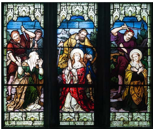
Βιτρώ μὲ τὸ μαρτύριο τῶν Ἁγίων Δύμφνας καὶ Γερεβέρνου καὶ ἐνὸς πιστοῦ συντρόφου τους.

Ἦ Ντεΐμον ἔστειλε τοὺς ὑπηρέτες του, γιὰ νὰ φέρουν ὀπίσω τὴν θυγατέρα του καὶ τὴν μικρὴ συνοδίᾳ της.