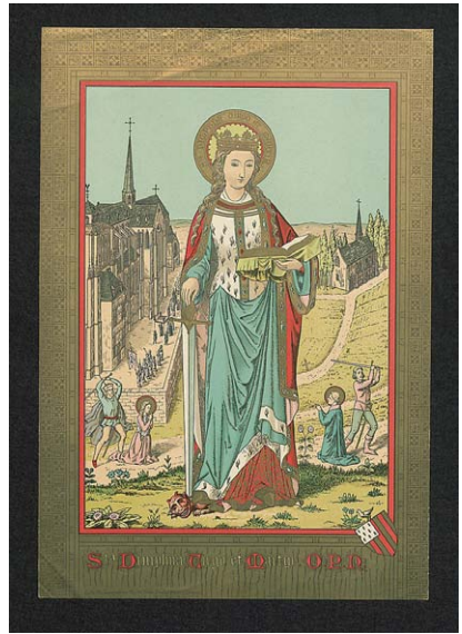
Ἁγία Δύμφνα. Λιθογραφία (1920-1937)

Ἡ Ἁγία Δύμφνα ἀνεδείχθη ἡ Προστάτις τῶν πασχόντων ἀπὸ διάφορες ψυχικὲς ἀσθένειες καὶ διαταραχές. Σήμερα ἡ Ἁγία Δύμφνα θεωρεῖται Προστάτις ὅλων ὧν ὑποφέρουν ἀπὸ συναισθηματικὴ δυσφορία καὶ διάφορες ψυχικὲς διαταραχές (ἀπόσυρσι, πανικός, κατάθλιψι), τῶν θυμάτων ἐνδο-οικογενειακῆς βίας (συμπεριλαμβανομένων τῶν θυμάτων αἰμομιξίας), καθὼς καὶ τῶν Ψυχιάτρων, Νευροχειρουργῶν καὶ Ψυχολόγων.