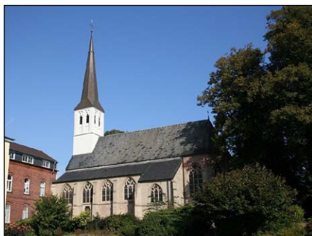
Ναός τοῦ Ἁγίου Γερεβέρνου. Σόνσμπεκ Γερμανία.

Ἄ φοῦ ἀνεζήτησε χωρὶς ἀποτέλεσμα μία τοιαύτη, ὁ Ντεΐμον ἄρχισε νὰ ἐπιθυμῇ τὴν θυγατέρα του, λόγω τῆς ἐντυπωσιακῆς ὁμοιότητός της μὲ τὴν μητέρα της.