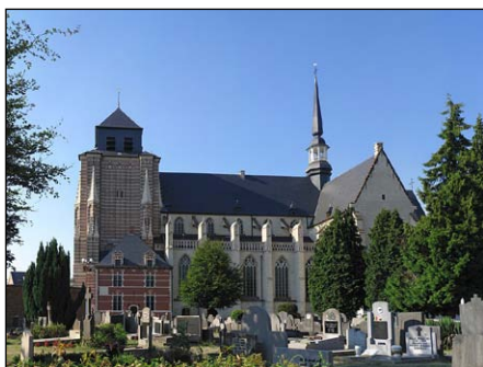
Ναός τῆς Ἁγίας Δύμφνας. Βέλγιο.