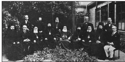
Πανορθόδοξο Συνέδριο τῆς Κωνσταντινουπόλεως - 1923.

Υπενθυμίζεται, ὅτι τῆς Ἡμερολογιακῆς Μεταρρυθμίσεως εἶχε προηγηθῆ ἡ Ἐγκύκλιος τοῦ 1920 , ὑπὸ τοῦ Πατριαρχείου Κωνσταντινουπόλεως, ὡς καὶ τὸ λεγόμενο Πανορθόδοξο Συνέδριο τῆς Κωνσταντινουπόλεως - 1923 , ἀμφότερα μὴ ἐκκλησιοπατερικῆς προοπτικῆς.