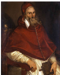
Πάπας Γρηγόριος ΙΓ' (1572-1585).

«Ἀλλὰ καὶ ἐν τοῖς μετέπειτα χρόνοις οἱ Ἕλληνες ἱεράρχαι ἐπανειλημμένως συνίστων τοῖς ὀρθόδοξοις τὴν ἀποφυγὴν καὶ τοῦ νέου τούτου ὄπλου τῆς λατινικῆς προπαγάνδας , ὡς Κύριλλος ὁ Λούκαρης, Παρθένιος ὁ Α', Παῖσιος ὁ Β', Κύριλλος ὁ Ε', Γρηγόριος ὁ Ζ', καὶ Ἀνθιμος ὁ Ζ'. Ἀλλὰ καὶ οἱ τῶν λοιπῶν Ἐκκλησιῶν Πατριάρχαι τὴν αὐτὴν ἐπεδείξαντο ἐν τῷ ζητήματι τούτῳ μέριμναν, ἐφ' ᾧ καὶ ἐν Παλαιστίνῃ καὶ ἐν Συρίᾳ καὶ ἐν Αἰγύπτῳ καὶ ἐν Κύπρῳ ἔτι ἐξεδόθησαν πρὸς τε τὸν κλῆρον καὶ τὸν λαὸν πατριαρχικαὶ καὶ ποιμαντορικαὶ Ἐγκύκλιοι, ἐν αἷς ἐτονίζετο ἡ χροιά καὶ ὁ σκοπὸς τῆς ἡμερολογιακῆς ταύτης μεταρρυθμίσεως καὶ συνεδέετο αὕτη πρὸς τὴν λοιπὴν γνωστὴν σειρὰν τῶν διαφόρων καινοτομιῶν τῆς παπικῆς Ἐκκλησίας », καθ' ὅσον «ἡ ὑπὸ τοῦ Πάπα Γρηγορίου τοῦ