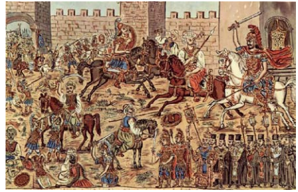
Ἀπεικόνιση τῆς τελικῆς μάχης στὴν ἄλωση τῆς Κωνσταντινούπολης ἀπὸ τὸν Ζωγράφο Θεόφιλο Χατζημιχαῖλ (1932). Ὁ Κωνσταντῖνος ἀπεικονίζεται νὰ πολεμᾷ πάνω σὲ ἕνα λευκὸ ἄλογο.