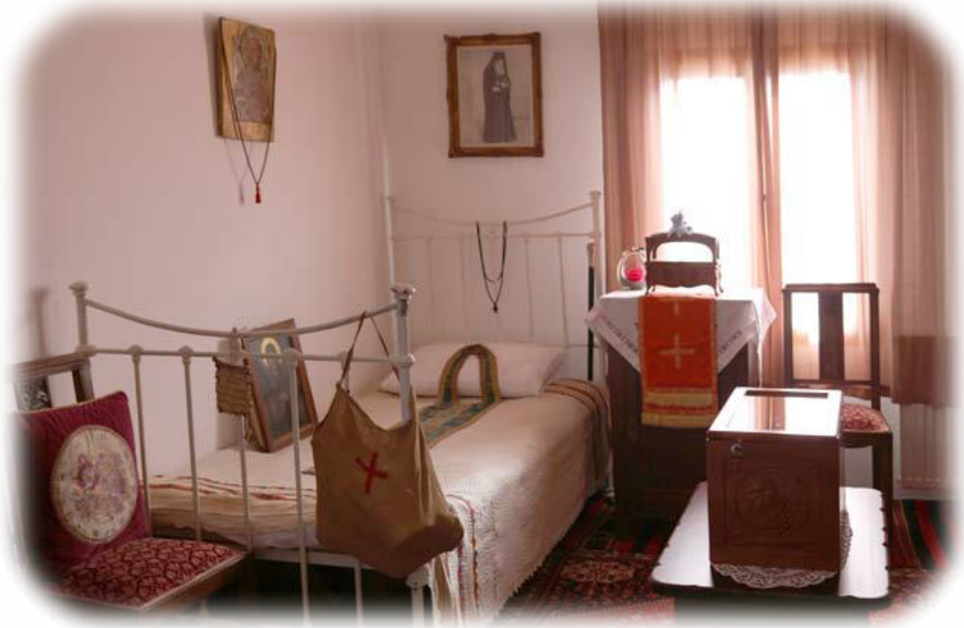
Προσωπικά αντικείμενα τοῦ Ὁσίου Τερωνύμου. Τερά Μονή Ἁγίας Παρασκευῆς, Ἀχαρναί Ἀττικῆς.