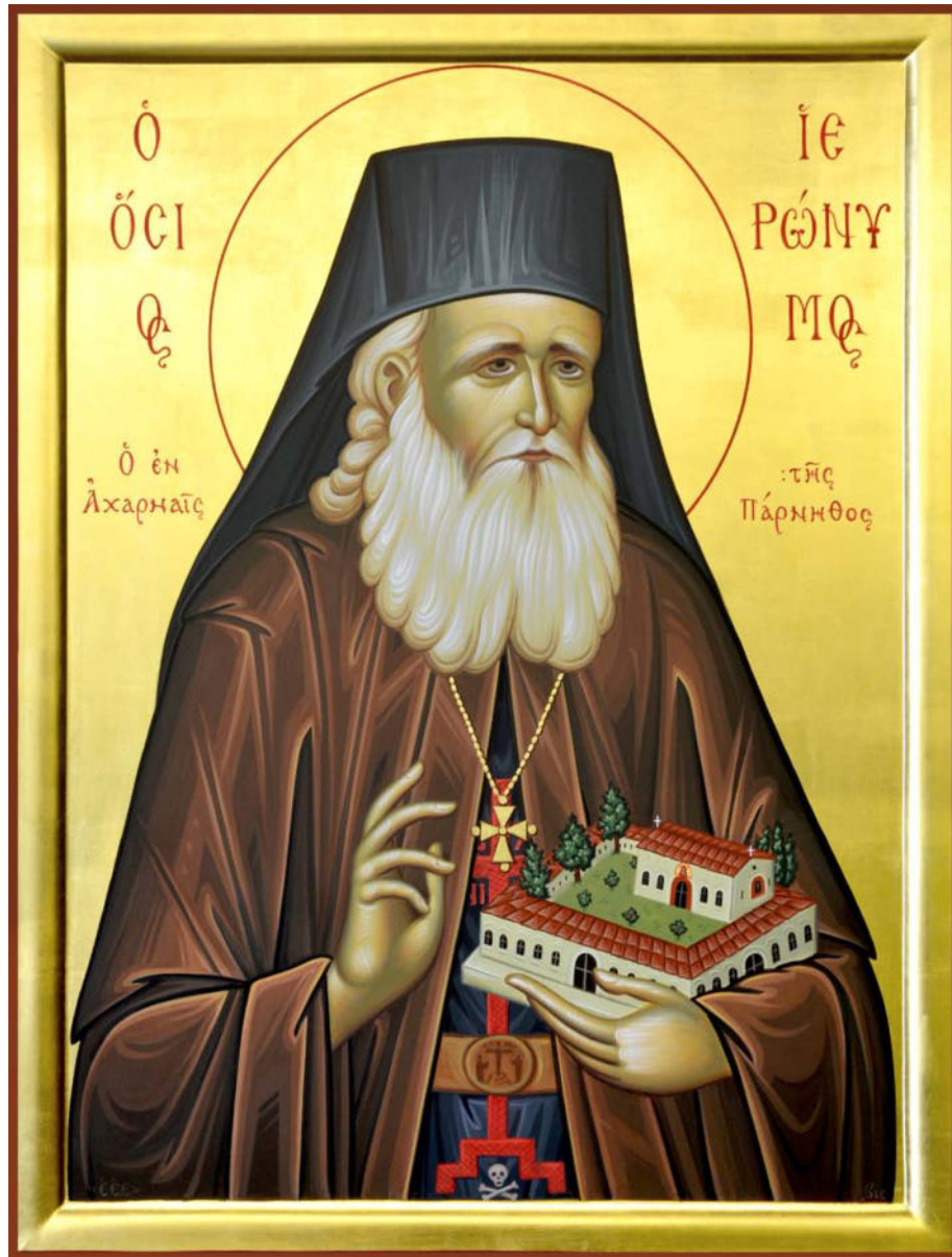
Ἱερὰ Εἰκὼν τοῦ Ὁσίου Ἱερωνύμου. Ἔργον τοῦ «Ἐργαστηρίου Ἐκκλησιοποιημένης Εἰκονογραφίας». Ἰανουάριος 2015, Φυλὴ Ἀττικῆς. Διαστάσεις πρωτοτύπου: 50 x 70 ἐκ.