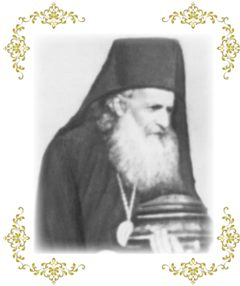
Ἅγιος Ἱερώνυμος ὁ ἐν Ἀχαρναῖς τῆς Πάρνηθος (1867-1943)