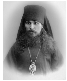
Ἅγιος Ἱερομάρτυς Μεθόδιος (Κρασνο- πέρωφ), Ἐπίσκοπος Ἀκμολίνσκ.