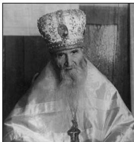
Άγιος Σεβαστιανός (Φόμιν), ό Όμολογητής.