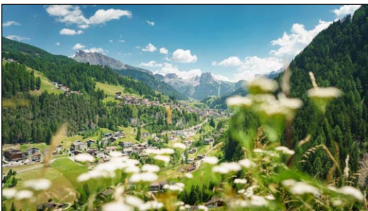
Χωριὸ Ἁγία Χριστίνα.

Ὅταν ὁ Ὅσιος Ἡλίας ἐπέστρεψε στὸ Σαλίνας, ὁ διοικητὴς τοῦ