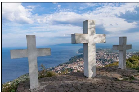
Τρεῖς Σταυροὶ σὲ ὄρος τῆς Πάλμι στὸ Ρήγιο, εἰς ἀνάμνησιν τῶν τριῶν Σταυρῶν τοῦ Γολγοθᾶ.

τοῦ ἀποκαλύφθηκε ὁ τόπος, στὸν ὁποῖον ὄφειλε νὰ ἐγκατασταθῆ γιὰ νὰ ἀσκητεύσῃ.