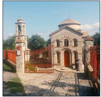
Ὁρθόδοξη Μονὴ τῶν Ὁσίων Ἡλίας καὶ Φιλάρετου στὴν Σεμινάρα.

Τῷ δὲ ἐν Τριάδι Παναγίῳ Θεῷ, τῷ ἐνδοξαζομένῳ ἐν τοῖς Ἁγίοις Αὐτοῦ, προσκύνησις καὶ εὐχαριστία, εἰς τοὺς αἰῶνας, τῶν αἰῶνων. Ἀμήν! →