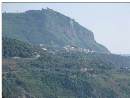
Τὸ Ὅρος Ἅγιος Ἡλίας (575 μ.).

Ἀ ίγιο ἀργότερα, ὁ φιλομόναχος Αὐτοκράτορας Λέων Ζ κάλεσε τὸν Ὅσιο Γέροντα νὰ πάῃ στὴν Κωνσταντινούπολι. Ῥ Ἡλίας πῆρε πάλι τὸν δρόμο, παρὰ τὰ ὀγδόντα χρόνια του. Σ τὴν Ναύπακτο προεῖπε, ὅτι ὁ τεράστιος στόλος τῶν Ἱσρακινοῦν ποὺ ἐτοιμαζόταν νὰ ἐπιτεθῆ στὴν Βασιλεύουσα θὰ ἀποτύγχανε στὴν προσπάθειά του, ἀλλὰ θὰ καταλάμβανε τὴν Θεσσαλονίκη. Ῥ Ὅσιος, ἄρρωστος, ἐφθασε μὲ δυσκολία στὴν Θεσσαλονίκη καὶ ἀφοῦ προσεκύνησε τὸν Ναὸ τοῦ Ἁγίου Δημητρίου παρέδωσε τὴν ψυχὴ του στὸν Κύριο, σὲ ἕνα χωρὶ πλῆσιον τῆς πόλεως, τὴν 17ῃ Αὐγούστου 903.