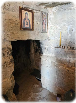
Τόπος άσκήσεως Όσιου Άντωνίου.