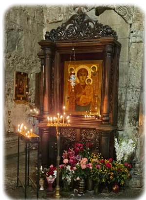
Ἱερός Ναός Κοιμήσεως Θεοτόκου, Τσίλκανι.

μιᾶς δοκιμασίας, νὰ τὴν ἀντιμετωπίσουν εὐαγγελικῶς, ἐν Χριστῷ.