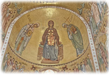
Ναός τῆς Ἁγίας Νίνας.