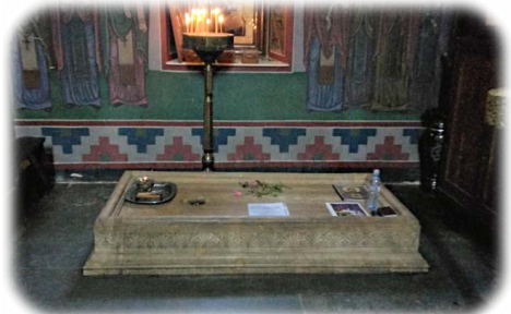
Ἱερὸ Μνήμα τοῦ Ὁσίου Ἀντωνίου.

Α πὸ τὴν Μονὴ ἀντικρίζει κανεὶς τὸν πύργο, ὁ ὁποῖος κτίσθηκε ἐπὶ τοῦ ἐρειπομένου στύλου τοῦ Ὁσίου: μετὰ ἀπὸ μακρὰ ἀσκητικὴ ἀλλὰ καὶ ἱεραποστολικὴ βιοτὴ στὴν κυρίως Μονή, ἡ ὁποία δημιουργήθηκε γύρω ἀπὸ τὸ πρῶτο κατάλυμα τοῦ ὁσίου Ἀσκητοῦ, ἐκεῖνος «ἀπομακρύνθηκε φυγαδεύων», γιὰ νὰ ζήσει τὰ τελευταῖα χρόνια τῆς ζωῆς του ὡς στυλίτης, κατὰ τὴν παράδοσι τῶν Στύλων Στυλιτῶν.