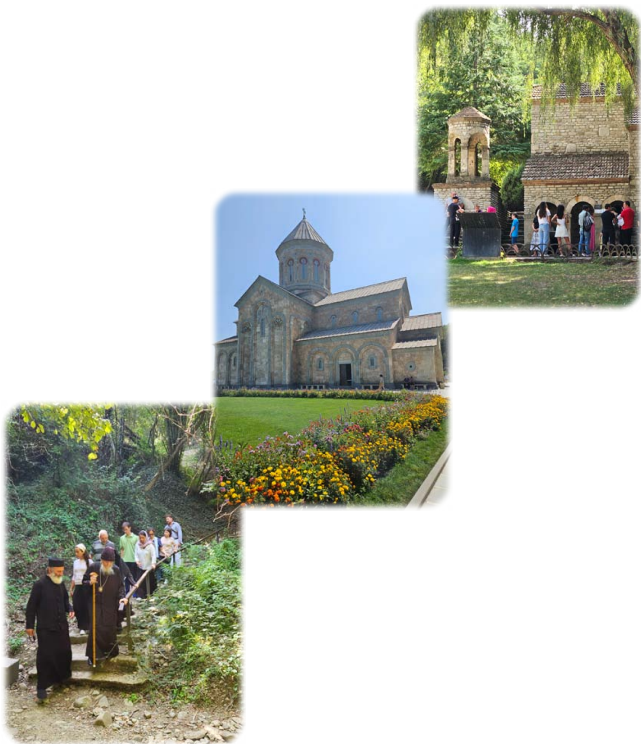
Μονὴ Ἁγίας Νίνας, Μπόντμπε.