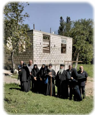
Τὸ Ίερό Ήσυχαστήριο τοῦ Ὁσίου Ἰωάννου Ζενταζένι.

κομιδῆς τοῦ Ἁγίου Μανδηλίου εἰς Κωνσταντινούπολιν, ὁ Σεβασμ. Τοποτηρητῆς μέ τινες Προσκυνητῶν μετέβη στό Κχόμπι στὴν δυτικὴ Γεωργία, ὅπου ἐτέλεσε Ἀγιασμόν στό ἀνεγειρόμενο ἤδη Ἡσυχαστήριο τοῦ π. Ἀλεξίου, πρὸς τιμὴν τῶν Ὁσίων Ἰωάννου Ζενταζένι καὶ