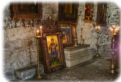
Ἱερὸ Μνήμα τοῦ Ἁγίου Ἰεσσαί.

Τὴν Πέμπτη , 16ῃ Αὐγούστου 2024 ἐκ. ἡμ., ἡ Ἀνάμνησις τῆς ἀνα-