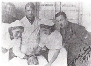
Εἰκ. 8. Νοσοκομεῖο Ἰωαννίνων - Θάλαμος τραυματιῶν.