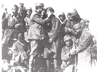
Εἰκ. 7. Ἱατρικὴ ἐξέταση στὴν πρώτη γραμμή.