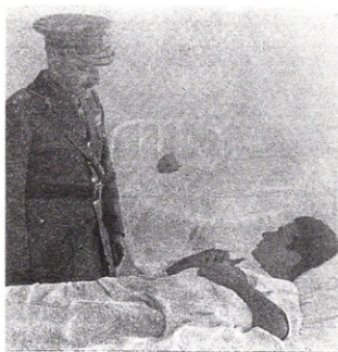
Εἰκ. 11. Ὁ ἀρχιστράτηγος τῆς Νίκης Α. Παπάγος ἐπισκέπτεται τραυματιῶν στὸ Νοσοκομεῖο Ἰωαννίνων.