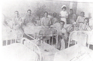
Εἰκ. 9. Νοσοκομεῖο Ἰωαννίνων - Θάλαμος τραυματιῶν