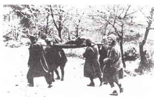
Εἰκ. 6. Μεταφορά τραυματιῶν