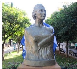
Προτομὴ Λέλας Καραγιάννη. Ἐξάρχεια.

Ἡ ἐγγονή της, Πρόεδρος τῆς Ὄργανώσεως Ἐθνικῆς Ἀντιστάσεως 1941-1944 «Λέλα Καραγιάννη - Μπουμπουλίνα», λειτουργεῖ ὡς θεματοφύλαξ τῆς παρακαταθήκης ποὺ κατέλειπε στὴν ἑλληνικὴ κοινωνία καὶ στὴν ἀνθρωπότητα μὲ τὴν θυσία της ἢ γυναίκα ποὺ ἔπεφτε κτυπημένη ἀπὸ τὶς σφαίρες τοῦ κατακτητοῦ.