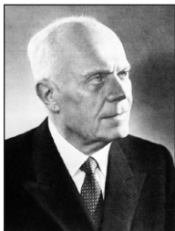
Σάντρο Περτίνι (1978-1985).

Ἦταν ἡ πρώτη φορὰ πὼς ἀπενέμετο σὲ νεκρὸ. Γιατί; Διότι ἡ Λέλα Καραγιάννη εἶχε ἀγωνισθεῖ γιὰ νὰ σώσει 76 Ἰταλοὺς, ὥστε νὰ μὴν ἐκτελεστοῦν ἀπὸ τοὺς Γερμανοὺς. Ὑπενθυμίζουμε, ὅτι Ἰταλοὶ τὴν εἶχαν συλλάβει τὴν πρώτη φορὰ, τὸ Ὀκτώβριο 1941.