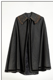
Προτομή και κάπα της Λέλας Καρα- γιάννη. Πολεμικό Μουσείο Αθηνών.

Ίδα και την μητέρα του, η οποία τελικά συνελή- φθη από τους Γερμανούς.