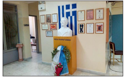
5ο Γυμνάσιο Ἁγίας Παρασκευῆς Ἀττικῆς.

θρωπα, τὴν ἐκρέμασαν καὶ τῆς ἐξήρ- θρωσαν τὰ χέρια. Τ ῆς κακοποίη- σαν τὰ ἄκρα καὶ τῆς τρύπησαν τὰ πλευρὰ μὲ χερούλι πόρτας. Ἄ λλὰ ἐκείνη δὲν μαρτύρησε. Δ ὲν κιό- τεψε (ἐδειλίασε). Δ ὲν πρόδωσε. Ἄ τσάλωσε τὴν ψυχὴ τῆς, γιὰ νὰ δίνει κουράγιο στοὺς συγκρατου- μένους τῆς.