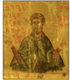
Ὅσιος Ἰλαρίων ὁ Ἰβηρ. Λεπτομέρεια ἀπὸ Εἰκόνα στὴν Μονὴ τῆς Ἁγίας Αἰκατερίνης, Σινᾶ.

τὸν οἶκον τοῦ Διοικητοῦ τῆς πόλεως. Α ὐτὴ τὴν ὥρα, μία ὑπηρετρία ἔβγαλε στὸν ἥλιο τὸν τετράχρονο παράλυτο υἱό του. Ὁ Ὅσιος Ἰλαρίων ἐζήτησε ἀπὸ τὴν γυναῖκα νερό. Ἐ νῶ ἐκείνη ἐπήγγαινε νὰ φέρῃ νερό, ὁ Ὅσιος Ἰλαρίων ἐσημείωσε ἐπὶ τὸν παῖδα τὸν σημεῖο τοῦ σταυροῦ καὶ τὸν ἐθεράπευσε. Τ ότε τὸ παιδί ἔτρεξε ἀμέσως πρὸς τὴν μητέρα του καὶ ὁ Ἅγιος Ἰλαρίων ἔφυγε βιαστικὰ ἀπὸ τὸν τόπο ἐκεῖνον.