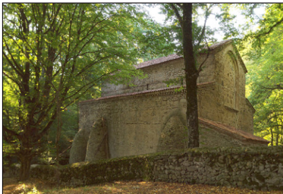
Μονὴ τοῦ Ἁγίου Δαβίδ. Ἄκουρα.

Ἐκεῖ, μετὰ τὸ θάνατο τοῦ πατέρα του καὶ τῶν ἀδελφῶν του καὶ τὴν μεταβίβασι τῆς κληρονομιάς τοῦ πατέρα του ἀπὸ τὴν μητέρα του ἐπ' ὀνόματί του, μετέτρεψε σὲ Μοναστήρι τὸ πατρικό του σπίτι, στὸ χωριὸ Ἄκουρα, πλησίον τοῦ Τελάβι, στὸ Καχέτι, τὸ κατέστησε Μετόχιον τῆς Μονῆς τοῦ Ὁσίου Δαβίδ