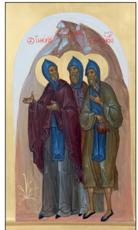
Οἱ Ὅσιοι Ἱμέριος, Οὐρσικιανὸς καὶ Φρονόνδος.