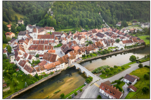
Τὸ χωριὸ Σαιντ Οὐρσαίν.

Ὁ Οὐρσικιανὸς ἦταν Ἴρλαν- δὸς Μοναχός, σύντροφος τοῦ Ἀγίου Κολομβανοῦ († Μνήμη: 23η Νοεμβρίου, † 615, βλ. ἐδῶ ), ὁ ὁποῖος μετανάστευσε ἀπὸ τὴν Ἴρλανδία στὴν Γαλλία καὶ ἐν συνεχείᾳ στὴν Ἰταλία, ὅπου ἵδρυσε τὸ περίφημο Μοναστήρι τοῦ Μπόμπιο (Bobbio) τὸ 614.