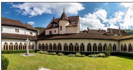
Μοναστήρι Ὁσίου Οὐρσικιανοῦ.

ὁποῖος εὐρίσκεται στὴν στροφή τοῦ ποταμοῦ Ντού (Doubs), ὁ ὁποῖος πηγάζει στὸ γαλλικὸ Ἰούρα καὶ διεισδύει γιὰ μικρὴ ἀπόστασι στὸ ἑλβετικὸ ἔδαφος, σχηματίζων τὴν προαναφερθεῖσα στροφή, στὴν ὄχθη τῆς ὁποίας εὐρίσκεται ἡ Ἐκκλησία.