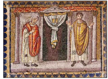
Ὁ Τελώνης καὶ ὁ Φαρισαῖος. Ψηφιδωτό, Ραβένα.

Ἄρα , τὸ πρῶτο βῆμα πρὸς τὴν ταπεινοφροσύνη εἶναι τὸ νὰ καταδικάζουμε τὸν ἑαυτό μας, νὰ ἀναγνωρίζουμε τὴν ἁμαρτωλότητά μας, καὶ ποτὲ νὰ μὴν κατηγοροῦμε, ποτὲ νὰ μὴν κρίνουμε καὶ κατακρίνουμε τοὺς ἄλλους.