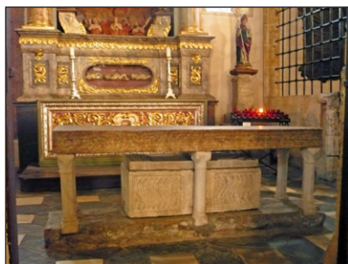
Ὁ Τάφος / ἡ Λάρνακα τοῦ Ἁγίου Μοδέστου. Ναός Μαρία Σάαλ, Αυστρία.

Στὴν Ἐπισκοπὴ τοῦ Κλάγκενφουρτ, ὁ Ἅγιος Μόδεστος τιμᾶται μαζί μὲ τὸν Ἅγιο Βιργίλιο τοῦ Σάλτσμπουργκ. ➔