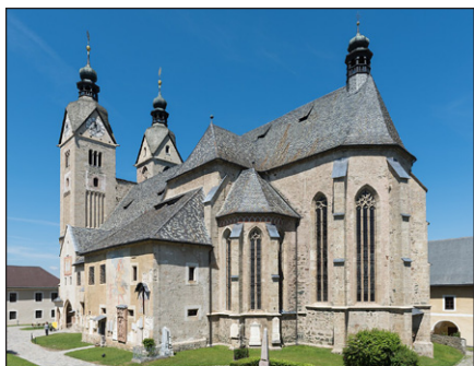
Ναός Μαρία Σάαλ, Αυστρία.

Ἐγινε τὸ κέντρο τοῦ ἐκχριστιανισμοῦ τῆς περιοχῆς, ἡ ὁποία ὀνομάζετο «Καραντανία», χωρισμένη ἀπὸ τὸ Πατριαρχεῖο τῆς Ἀκουϊλείας καὶ εὐρίσκετο πλέον ὑπὸ τὸ Σάλτσμπουργκ.