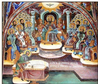
Ἡ Β' Ἁγία Οἰκουμενικὴ Σύνοδος.

Τὸ τρίτον , περιλαμβάνον τὸ ὄγδοον Ἄρθρον, εἰς τὸ ὁποῖον γίνεται λόγος περὶ τοῦ Κυρίου καὶ Ζωοποιοῦ Ἁγίου Πνεύματος.