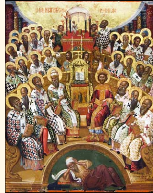
Ἡ Α' Ἁγία Οἰκουμενικὴ Σύνοδος.

Τὸ δεύτερον , περιλαμβάνον τὰ ἔξ ὑπόλοιπα Ἄρθρα, τὰ ὁποῖα ἀναφέρονται εἰς τὸ δεύτερον Πρόσωπον τῆς Ἁγίας Τριάδος, τὸν Κύριον ἡμῶν Ἰησοῦν Χριστόν καὶ εἰς τὸ σωτηριῶδες ἔργον Του ὑπὲρ τῶν ἀνθρώπων.