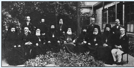
Πανορθόδοξο Συνέδριο τῆς Κωνσταντινουπόλεως - 1923.

πρὸς τὴν Πατερικὴ Παράδοσι Οἰκουμενικῆς Κινήσεως , ὑπὸ τὴν μορφὴν τοῦ Διαχριστιανικοῦ καὶ περαιτέρω Διαθρησκευτικοῦ Συγκρητισμοῦ 4 .