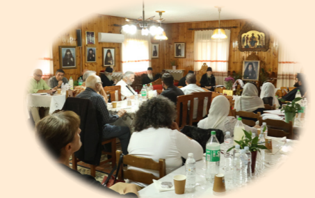
Κληρικολαϊκή Σύναξις της Ίερας Μητροπόλεως 9η Σεπτεμβρίου 2024 έκ. ήμ. Στήν Ίερά Μονή των Αγίων Κυπριανού και Ίουστίνης, Φυλή Άττικής.