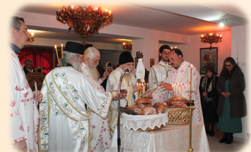
Πανήγυρις Αγίου Μερκουρίου 25η Νοεμβρίου 2024 έκ. ήμ. Στόν Ίερό Ναό Όσίας Ξένης της Ρωσίδος, Νέα Παλάτια Ώρωπού Άττικής.

«Ποίμαινε τὰ Πρόβατά Μου!... Βόσκει τὰ Άρνία Μου!...»