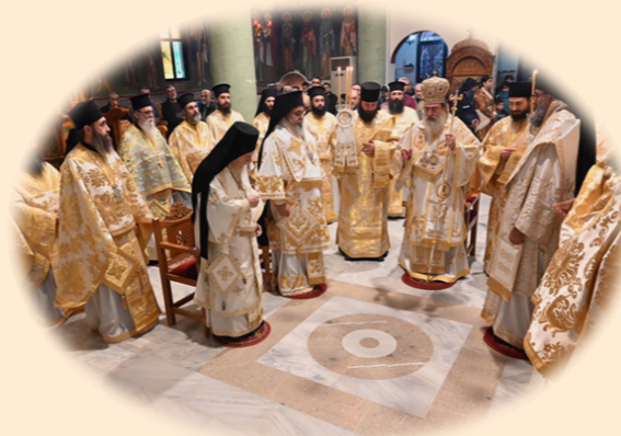
Έορτή Αγίου Ίωάννου Χρυσοστόμου 13η Νοεμβρίου 2024 έκ. ήμ. Άρχιερατικό Συλλείτουργο στον ιερό Ναό Αγίου Νικολάου, Άχαρνές Άττικής.