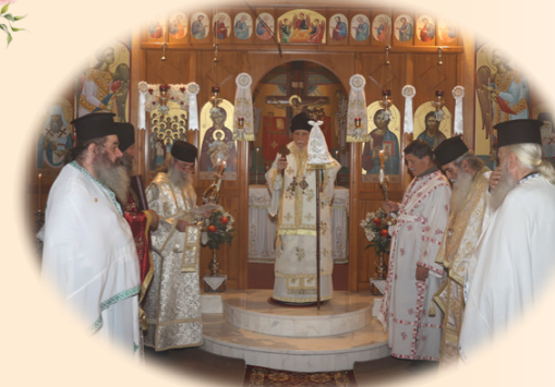
Άγρυπνία-Πανήγυρις Αγίων Αγγέλων 8η Νοεμβρίου 2024 έκ. ήμ. Στήν όμώνυμη Ίερά Μονή, Αφίδναι Άττικής.