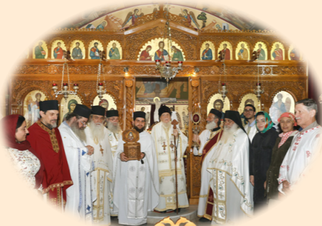
Άγρυπνία επί τη δεκάτη έβδομη Έπετειώ της Χειροτονίας του Σεβασμ. Μητροπολίτου μας 5η Όκτωβρίου 2024 έκ. ήμ. Στήν Ίερά Μονή Αγίας Παρασκευής, Άχαρνές Άττικής.