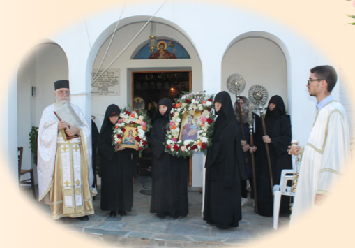
Πανήγυρις Παναγίας Μυρτιδιωτίσης 24η Σεπτεμβρίου 2024 έκ. ήμ. Στήν όμώνυμη Ίερά Μονή, Αφίδναι Άττικής.