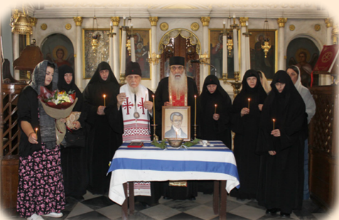
Ίερό Μνημόσυνο στο Ναύπλιο του άειμνήστου Κυβερνήτου Ίωάννου Καποδίστρια († 27.9.1831) 27η Σεπτεμβρίου έκ. ήμ. Στό Ναό του Αγίου Σπυρίδωνος.