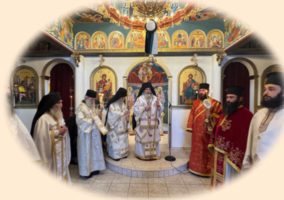
Πανήγυρις της Αγίας Νεομάρτυρος Αικατερίνης τής έν Μάνδρα 15η Νοεμβρίου 2024 έκ. ήμ. Άρχιερατικό Συλλείτουργο στον ιερό Ναό Ύψώσεως του Τιμίου Σταυρού, Μαγούλα Άττικής.