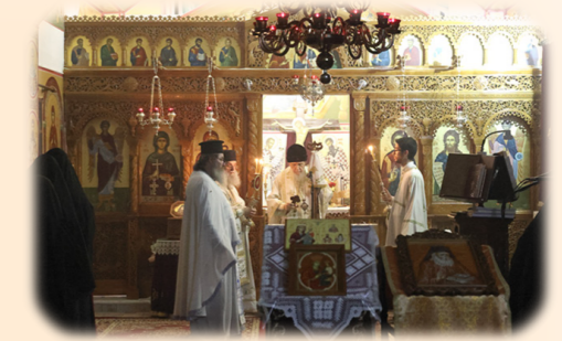
Άγρυπνία προς τιμήν των ιδιαίτερων Προστατών της Ίερας Μητροπόλεως μας 3η Νοεμβρίου 2024 έκ. ήμ. Στήν Ίερά Μονή Αγίας Παρασκευής, Άχαρνές Άττικής.