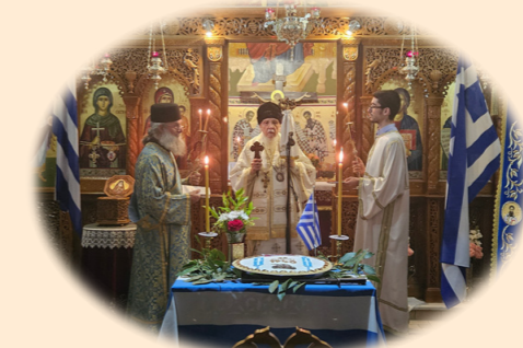
Άγρυπνία έπί τη Έπετειώ των Νικητηρίων 15/28η Όκτωβρίου 2024 έκ. ήμ. Στήν Ίερά Μονή Αγίας Παρασκευής, Άχαρνές Άττικής.