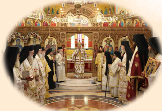
Πανήγυρις Αγίων Κυπριανού και Ίουστίνης 2α Όκτωβρίου 2024 έκ. ήμ. Στήν όμώνυμη Ίερά Μονή, Φυλή Άττικής.