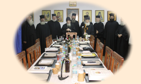
Ένάτη Ίερατική Σύναξις της Ίερας Μητροπόλεως 16η Όκτωβρίου 2024 έκ. ήμ. Στά Γραφεία της Ίερας Μητροπόλεως, Φυλή Άττικής.