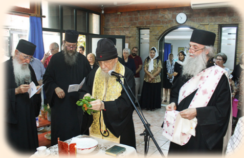
Άγιασμός επί τη Έναρξει του Νέου Έκκλησιαστικού Έτους 5η Σεπτεμβρίου 2024 έκ. ήμ. Στά κοινά Γραφεία της Ίερας Μητροπόλεως μας και του Συλλόγου μας «Άγιος Φιλάρετος ό Έλεήμων».