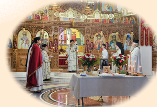
Κτητορικό Μνημόσυνο 6η Όκτωβρίου 2024 έκ. ήμ. Στήν Ίερά Μονή των Αγίων Κυπριανού και Ίουστίνης, Φυλή Άττικής.