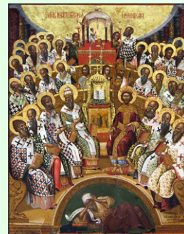
Ἁγία Ἀ΄ Οἰκουμενικὴ Σύνοδος

Σᾶς ἐμπιστεύομαι στὸν Θεὸ καὶ στὸν λόγον, τὸν ὁποῖο ἡ Χάρις Του μᾶς ἀπεκάλυψε· αὐτὸς ὁ λό-